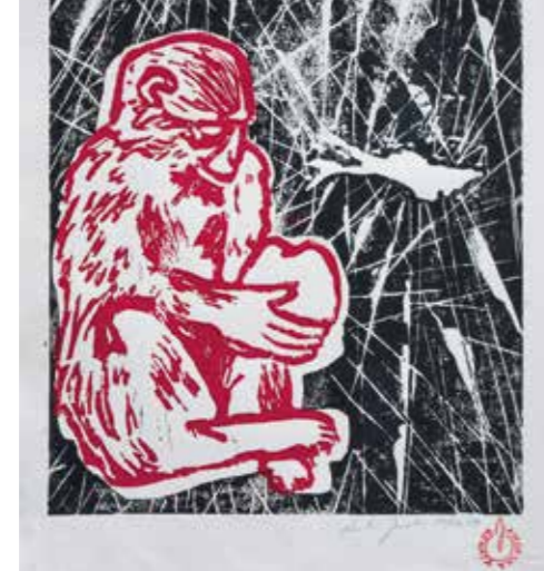
Renata Jaworska, »Ohne Titel«, 2013 Kulturamt Bodenseekreis