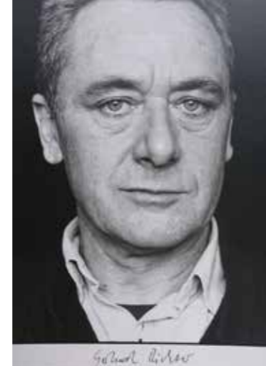
Gerhard Richter, ca. 1980er Jahre