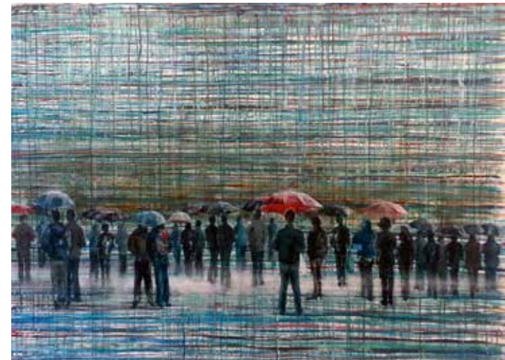
Klaus Maschanka, »Warten 2«, 2016